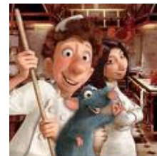
Metáfora 10: Un verdadero trabajo en equipo

En el restaurante hay camareros y cocineros. Los cocineros no suelen salir al salón a servir platos, porque pueden causar mala impresión con sus ropas probablemente manchadas de grasa. Y los camareros evitan entrar en la cocina, no vayan a manchar su uniforme. No obstante, acabada la jornada, camareros y cocineros charlan un rato juntos. Los camareros comentan cuáles han sido los platos más apreciados por los clientes, y los cocineros comentan las novedades que están preparando para el menú del día siguiente. En fin, un trabajo en equipo (aunque también es cierto que hoy en día es más fácil lograr fortuna y gloria trabajando como cocinero que como camarero).