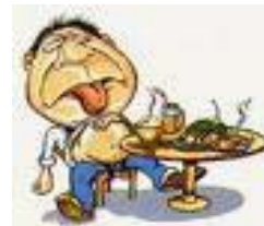
Metáfora 2: Por si no tuviéramos bastante, ahora un trabajito.

Un hombre realmente muy obeso fue a la consulta del doctor que le dijo que no podía seguir así y le puso una dieta. Al poco tiempo el hombre murió. El doctor asistió al entierro y le preguntó a la viuda sobre las circunstancias de la muerte. Ella le contó que en las últimas semanas su marido había adquirido un hábito extraño. Resulta que después de comer lo mucho que comía siempre sacaba un papel y decía: “bueno, ahora vamos a por la dieta que me dio el doctor” .