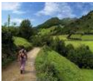
Metáfora 7: La calidad no es un destino sino el camino

Para ilustrar esta idea nos gusta usar la metáfora del viaje a Pekín. Si una persona decide marcharse de Barcelona para ir a vivir a Pekín y hacer el viaje caminando, no ha decidido vivir en Pekín, lo que ha decidido es vivir caminando. Al cabo de mucho tiempo de viaje habrá llegado a los Pirineos, y la gente que se quedó en Barcelona admirará sus progresos. Pero desde los Pirineos él verá aún un largísimo camino por delante, que quizá no acabe nunca. Comprenderá entonces que su destino es disfrutar cada día de la siguiente etapa del camino.