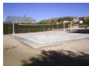
Metáfora 9: A que vamos a jugar: a tenis, a baloncesto o a voleibol

Después de haber estado jugando muchos años al tenis, resulta que ahora nos dicen que tenemos que jugar al baloncesto. Estamos dispuestos a ello, vamos a aprender las nuevas técnicas y tácticas de equipo. Puede ser divertido. Pero, por favor, que nos quiten la red que hay en medio de la pista, porque nos tropezamos con ella a cada momento. Además, que