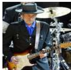
Metáfora 8: A Bod Dylan lo que le gusta es cantar

La situación sería comparable a pedirle a Bob Dylan, quién obviamente disfruta enormemente encandilando desde el escenario a miles de personas en sus conciertos, que se bajase del escenario para organizar el público en grupos de tres o cuatro personas, repartiéndose guitarras y fuese visitando los grupos a ver cómo va la cosa.