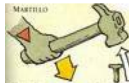
Metáfora 6: Para clavar clavos existen los martillos

Un carpintero estaba muy orgulloso de su habilidad para clavar clavos con las tenazas. Había depurado su técnica, aunque eso sí, a veces los clavos se torcían. Entonces él se quejaba con amargura de que cada vez los clavos son de peor calidad. Pero un día se sintió muy ridículo cuando descubrió que para clavar clavos existen los martillos. Al poco de aprender a usarlo tuvo que reconocer que para clavar clavos no hay nada como un buen martillo.