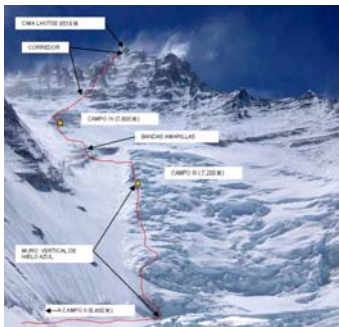
Metáfora 5: Cuanto más ambicioso es el objetivo más necesario es un plan paso a paso

Apurando el argumento anterior, nos gusta insistir en que, en general, un plan detallado de pasos a seguir no sólo no es paternalista sino que es imprescindible si uno quiere conseguir objetivos ambiciosos, en cualquier orden de la vida. La metáfora del Everest ilustra perfectamente esta idea.