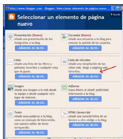
Figura 5. Enlazar los blogs de los alumnos

El resultado final del blog del profesor es el mostrado en la Figura 6, donde los blogs de los alumnos están situados en la parte de la derecha de la ventana.