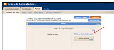
Figura 4. Aspecto inicial del blog del profesor

Finalmente, accedemos al blog del profesor (véase Figura 4) y podemos personalizarlo con diferentes tipos de elementos pulsando el hipervínculo “Añadir un elemento de página”. En este caso, estamos interesados en añadir los enlaces a los blogs de los alumnos. Para ello usaremos el botón “AÑADIR AL BLOG” correspondiente al elemento “Lista de vínculos”, tal y como se indica en la Figura 5.