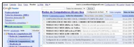
Figura 7. Lectura del eEdublog con Google Reader

Para ello utilizamos nuestra cuenta de Google, entramos al lector de Feeds Google Reader y configuramos todos los blogs para su lectura centralizada. En la Figura 7, apreciamos que el acceso a los blogs se puede realizar en la parte inferior izquierda de la ventana de Google Reader.