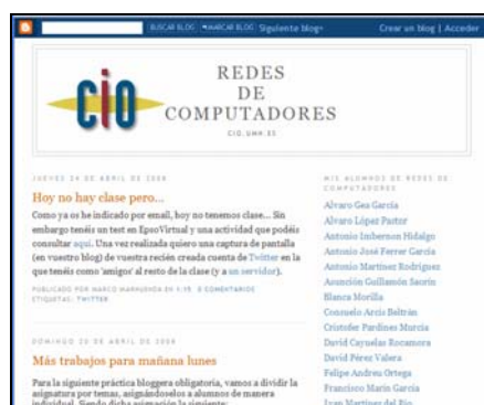
Figura 6. Aspecto final del Edublog

El resultado final del blog del profesor es el mostrado en la Figura 6, donde los blogs de los alumnos están situados en la parte de la derecha de la ventana.