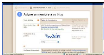
Figura 3. Asignación de un nombre a un blog.

A continuación, debemos asignar un nombre al blog, por ejemplo, http://redesdecomputadores-umh.blogspot.com , tal y como se indica en la Figura 3. Finalmente, sólo habrá que seleccionar una plantilla que le de un formato agradable al blog y ya estamos listos para postear.