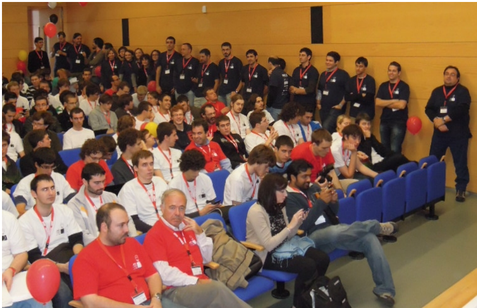
Figura 2: Momentos antes de la entrega de premios en SWERC 2012.

infraestructura y la dependencia que de ella se tiene. La infraestructura incluye los ordenadores que utilizarán los equipos participantes durante las cinco horas de la competición más el sistema de jueces automáticos. Un fallo durante la competición puede ser motivo de suspensión y aplazamiento, lo que implicaría la preparación de un nuevo conjunto de problemas.