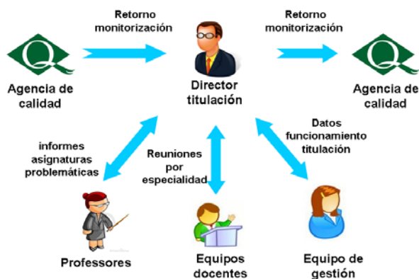
Figura 1: Proceso de monitorización previo.

Para optimizar el tiempo de dedicación de todo el personal involucrado, se propone un rediseño del proceso actual evaluación y la utilización de una herramienta de soporte para mejorar de forma global la eficiencia del proceso. Por una parte, el nuevo proceso permite una mejor coordinación del equipo involucrado. Por otra parte, la herramienta ha sido diseñada para trabajar de forma colaborativa y permite que profesores y director de programa (es decir, el profesor responsable del grado o máster) puedan compartir toda la información relacionada con un programa determinado para poder garantizar los procesos relativos a la calidad docente. La herramienta se encarga de recoger y analizar todas las evidencias relacionadas con el proceso educativo de un semestre y permite realizar comparativas con los semestres anteriores, permitiendo que el responsable del programa tenga una visión completa de la información más relevante que le permita diseñar las medidas correctoras que estime más convenientes.