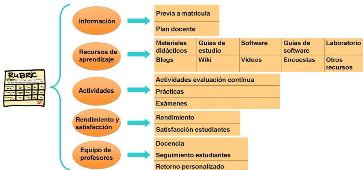
Figura 3: Detalle de los indicadores evaluados en la matriz de evaluación.

Cabe destacar que ahora cada asignatura tiene un proceso interno de evaluación de la calidad y que exige al profesor responsable autoevaluarse. Adicionalmente, también existe un segundo nivel de evaluación interno a nivel de equipo docente. Un posible punto débil del proceso sería que el profesor no autoevalúe correctamente las asignaturas de las cuales es responsable, es decir, que no describa correctamente los problemas reales que tiene cada asignatura. Para evitar estos posibles fallos, existen los equipos docentes. Los equipos docentes velan por la calidad dentro de las asignaturas de su área y unifican criterios de seguimiento y de docencia dentro de sus asignaturas. Una vez realizados los informes individuales de las asignaturas, los miembros de un mismo equipo docente realizan un informe común sobre el funcionamiento de las asignaturas del área donde quedan reflejados los problemas y las mejoras que se realizarán en común. Por lo tanto, en el caso que un profesor no evalúe correctamente su asignatura, el problema acabará aflorando dentro del seguimiento del equipo docente a corto o a medio plazo.